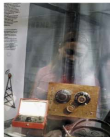
Nytt för i år är teknikutställningen.