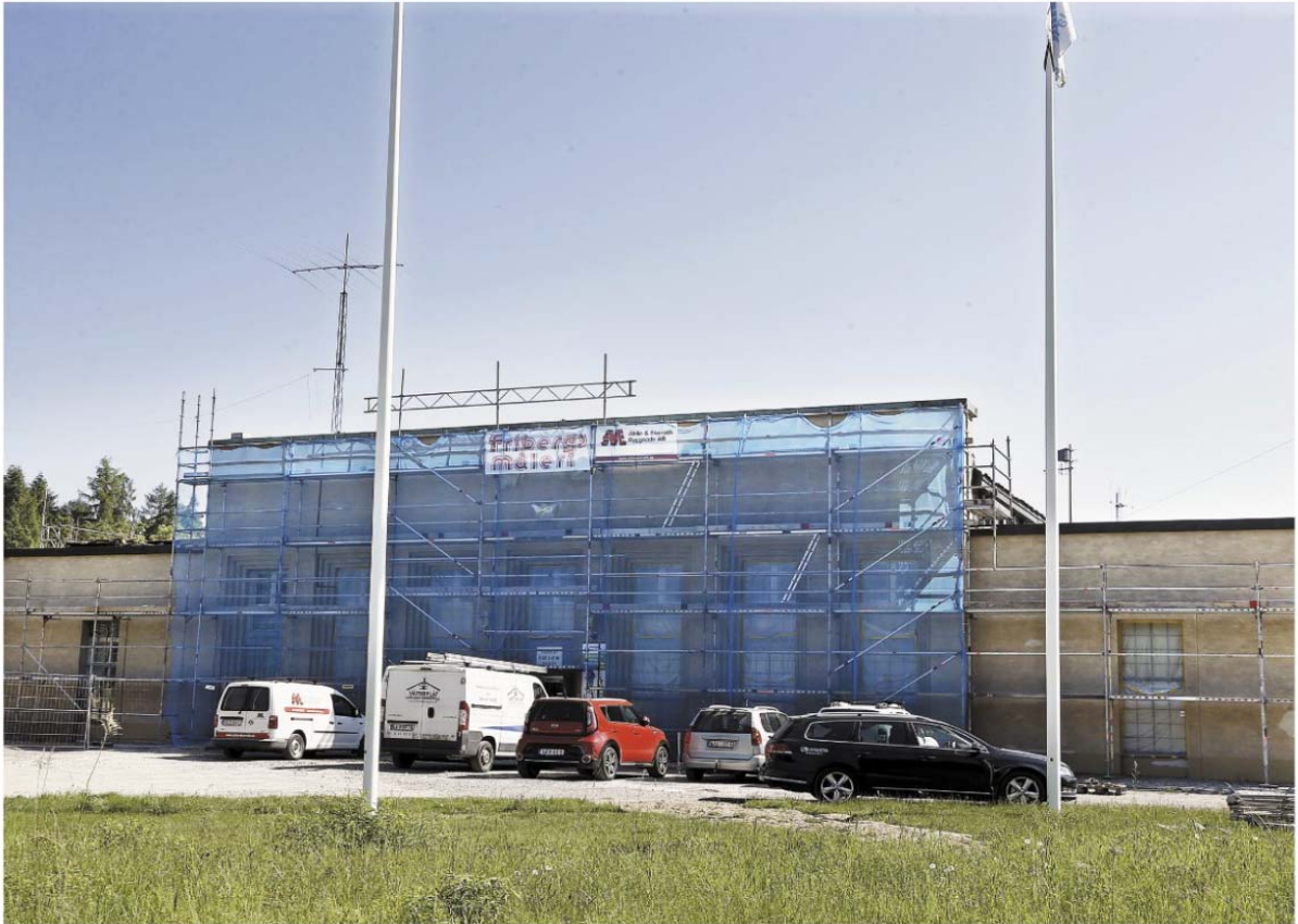
Även om utsidan ser ut som en byggarbetsplats så pågår verksamheten som vanligt på Rundradiomuseets insida.